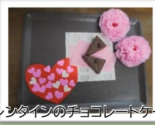
バレンタインの手ヨコレートケーキ