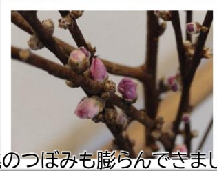
桃のつぼみも膨らんできました