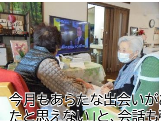
今月もあらたな出会いがありました。「はじめてあったと思えない」と、会話も弾みます。

悠々の郷を利用している方は、様々な目的があり「第2の家」「トレーニングのため」「サロン感覚」「外食(風呂)のため」と、人それぞれです。