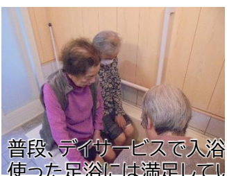
普段、デイサービスで入浴していない方も温泉の素を使った足浴には満足していただけたようです。