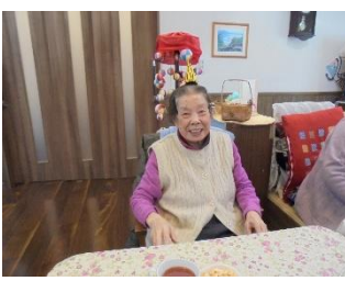
お誕生日おめでとございます