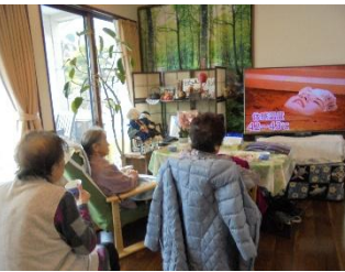
来月の行事「桃の節句」の準備。