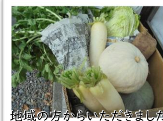
地域の方からいただきました