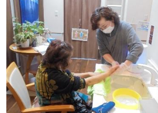
頭皮のマッサージと足浴