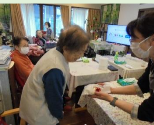
お誕生日おめでとうございます