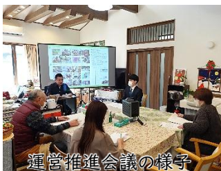
運営推進会議の様子

悠々の郷では、利用者・ご家族にご理解をいただき、年に1回、1日を通した研修会を実施しています。8回目を迎えた今回も著名な講師の方々より貴重な講話がありました。また、悠々の郷では、啓発啓蒙活動の一環として認知症介護講座を行っています。今月は南三陸高等学校と志津川小学校にて行いました。